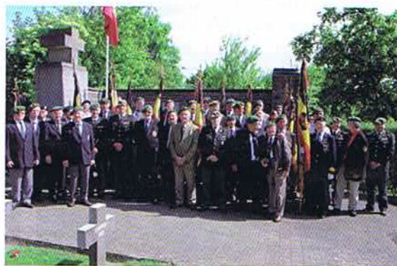
Photos des participants