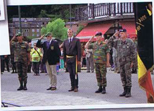
Mesa - Cérémonie à La Roche