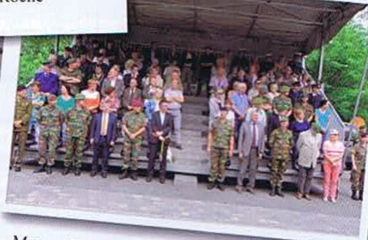
Mesa – Tribune d'honneur lors du défilé final à Houffalize