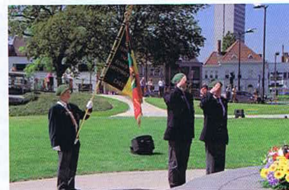
Le Président et le Secrétaire saluent le monument du Roi Léopold III et de l'Armée belge de 1940.