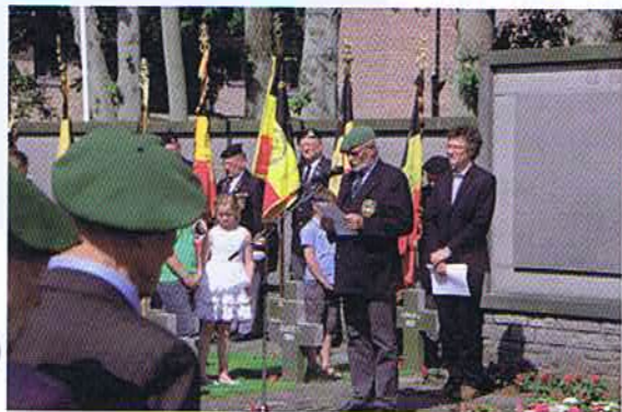
Notre Président lors de son allocution

Après l'office religieux, l'assemblée rendit hommage aux victimes militaires et civiles de la sauvagerie nazie.