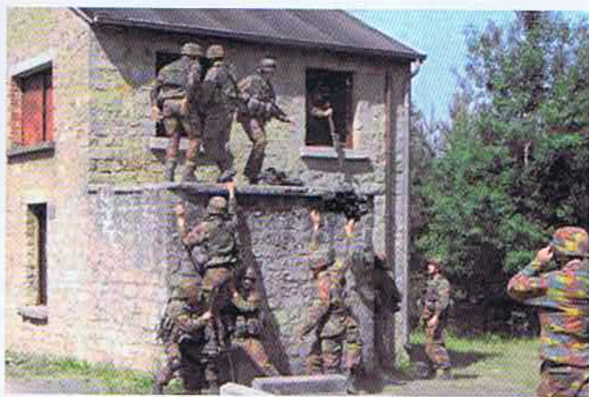
Entraînement au difficile exercice qu'est le combat en localité.