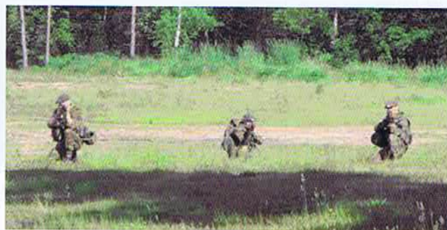
Une équipe s'entraîne à la progression sous le feu de l'ennemi.