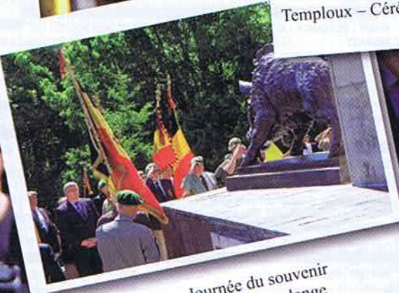
Mesa – Journée du souvenir Monument de Martelange