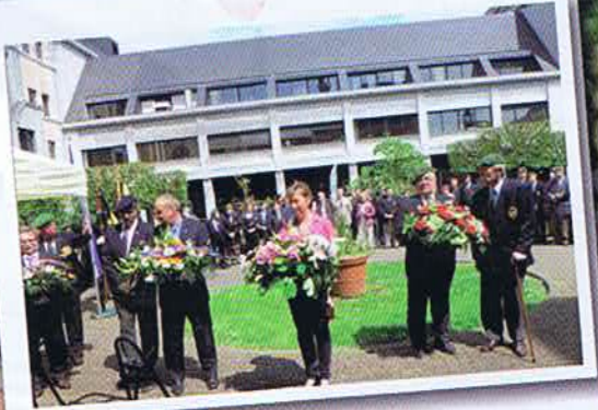
Temploux – Cérémonie à l'Hôtel de Ville de Namur