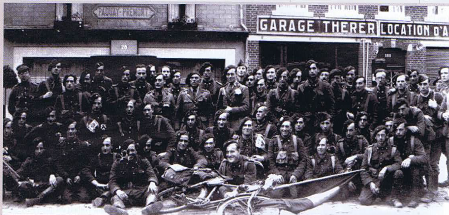
Souvenir de la mobilisation du 26 septembre 1938 PPR Laroche 1er octobre 1938 (14h40)