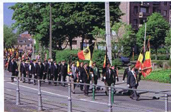
Notre Fraternelle défile en tête

En présence de hautes autorités militaires belges dont les représentants du Roi et du Chef de la Défense, ainsi que des édiles provinciaux et communaux, la cérémonie a respecté son scénario traditionnel : allocutions, dépôts de fleurs au monument du Roi Léopold III de l'Armée belge de 1940 par toutes les autorités et les nombreuses associations patriotiques dont notre Fraternelle et enfin le défilé des associations patriotiques et de notre Fraternelle.