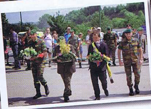
Mesa – Cérémonie à Bastogne