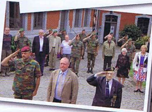
Mesa – Cérémonie à Marche-En-Famenne